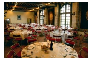
Les Dépendances du XVIIe

Vaux-le-Vicomte – 77950 Maincy – France Tél. : +33 (0)1 64 14 41 90 – Fax : +33 (0)1 60 69 90 85 www.vaux-le-vicomte.com