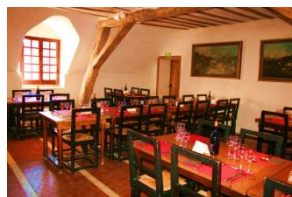
Restaurant « L'Ecureuil »